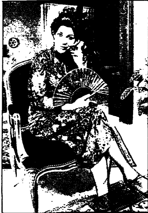
ليمة عباس عماره

هذه الأيام تجد الأم تفتح بطنها التي المدرسة بمجرد بلوغه الثالثة أو الرابعة